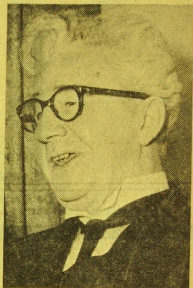
Olafur Thors — opposition —

Resultatet blev en regeringskrise. Selvstændighedspartiet gjorde først forsøg paa at danne regering, men det lykkedes ikke, og til sidst dan-