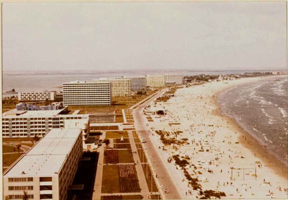
Einkaskjalasafn Bjarna Benediktssonar