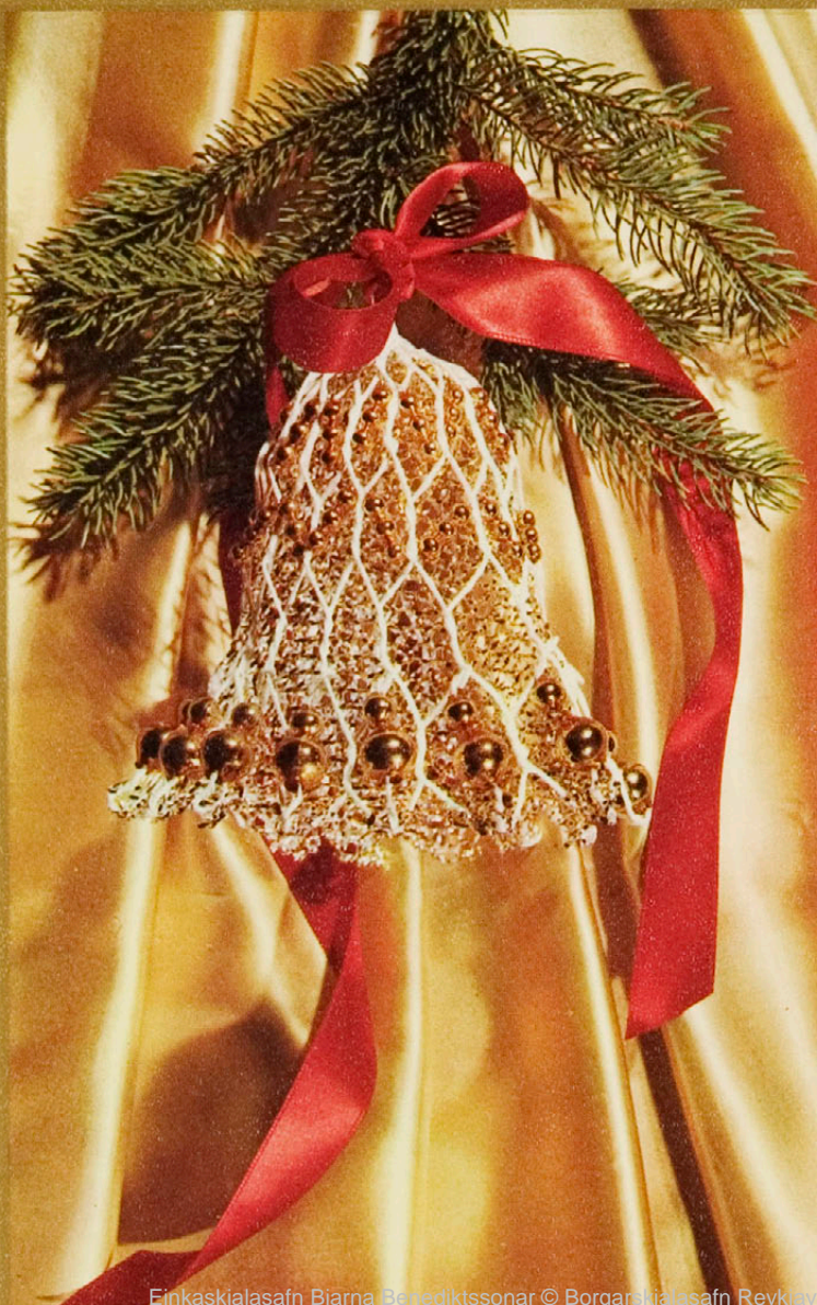
Einkaskjalasafn Bjarna Benediktssonar