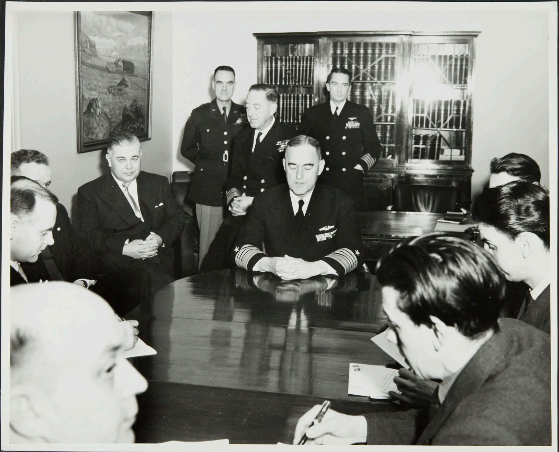
Einkaskjalasafn Bjarna Benediktssonar © Borgarskjalasafn Reykjavíkur