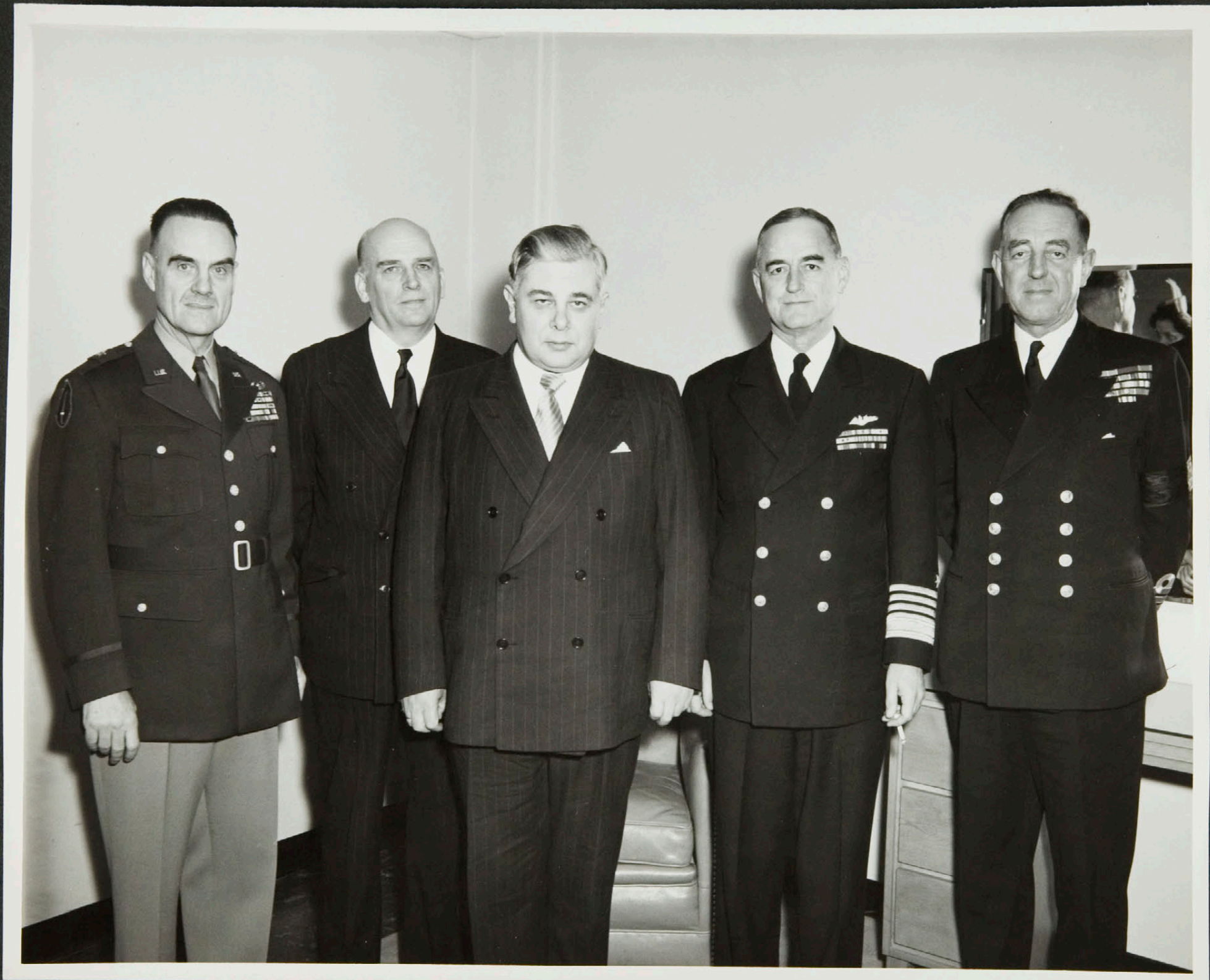
Einkaskjalasafn Bjarna Benediktssonar