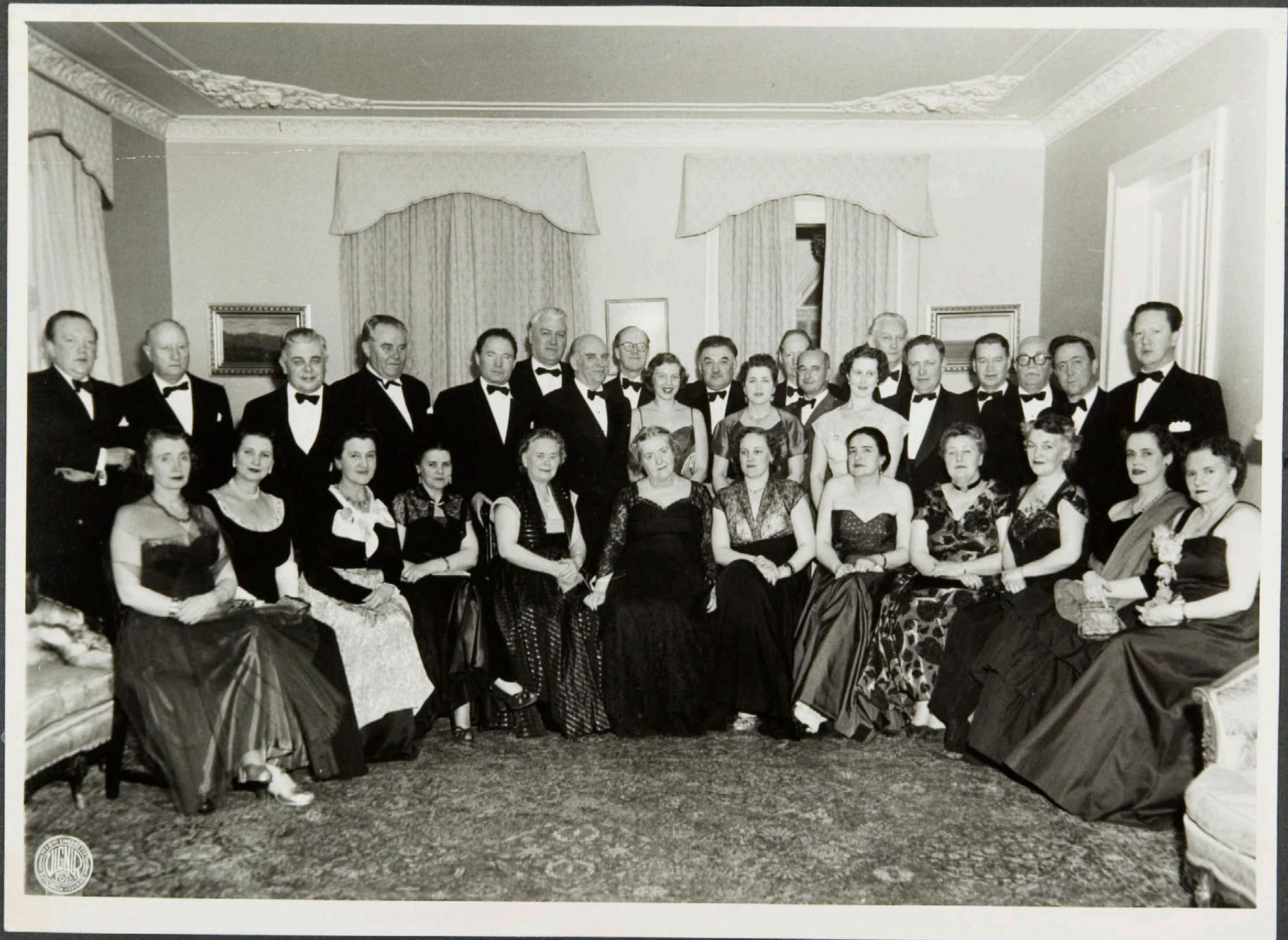
Einkaskjalasafn Bjarna Benediktssonar