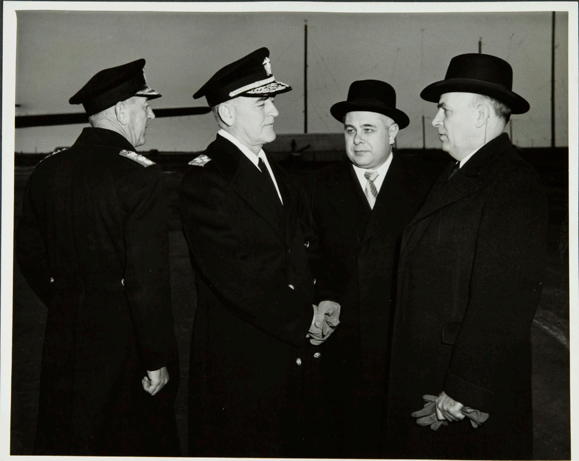
Einkaskjalasafn Bjarna Benediktssonar