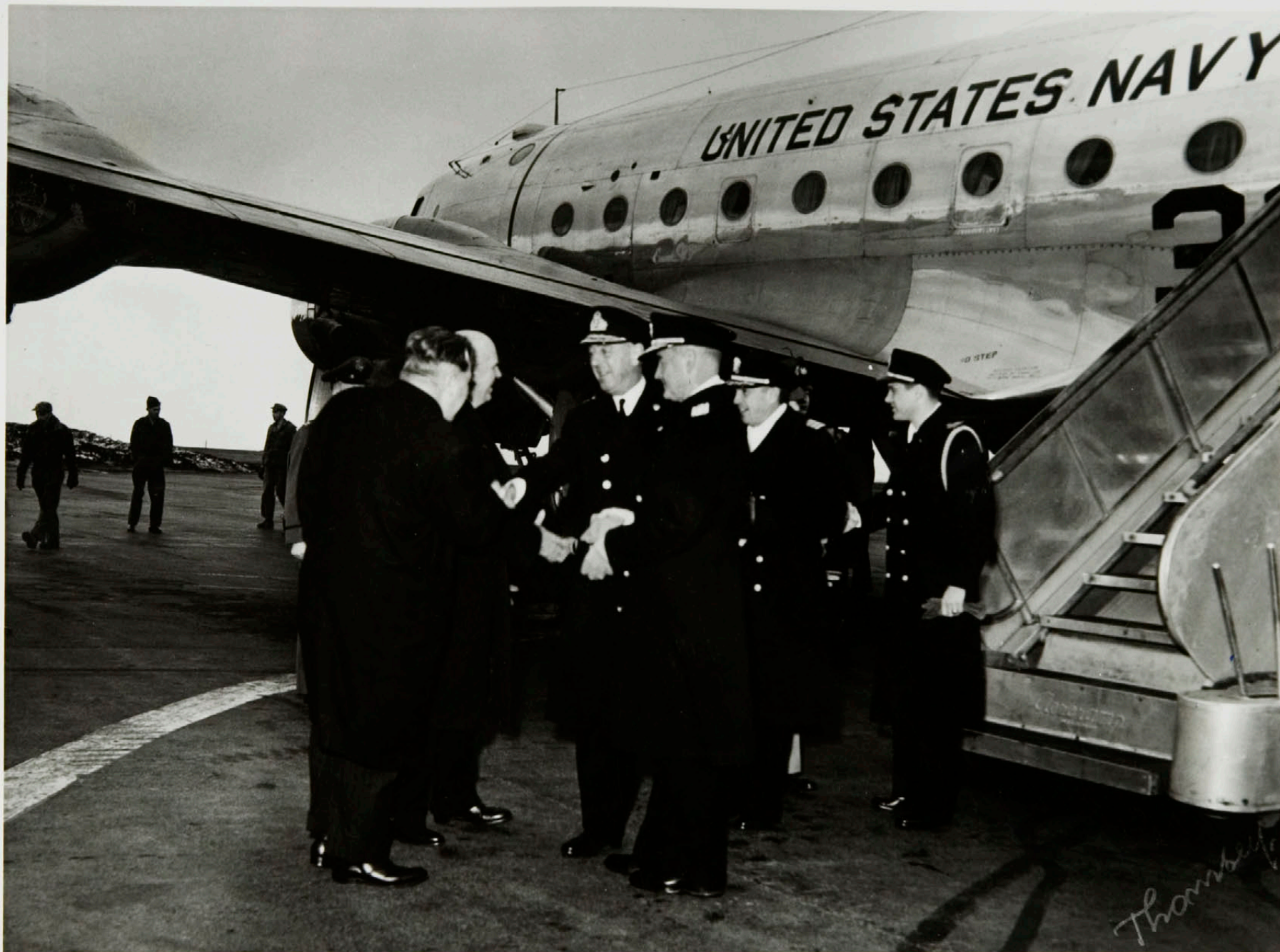
Einkaskjalasafn Bjarna Benediktssonar