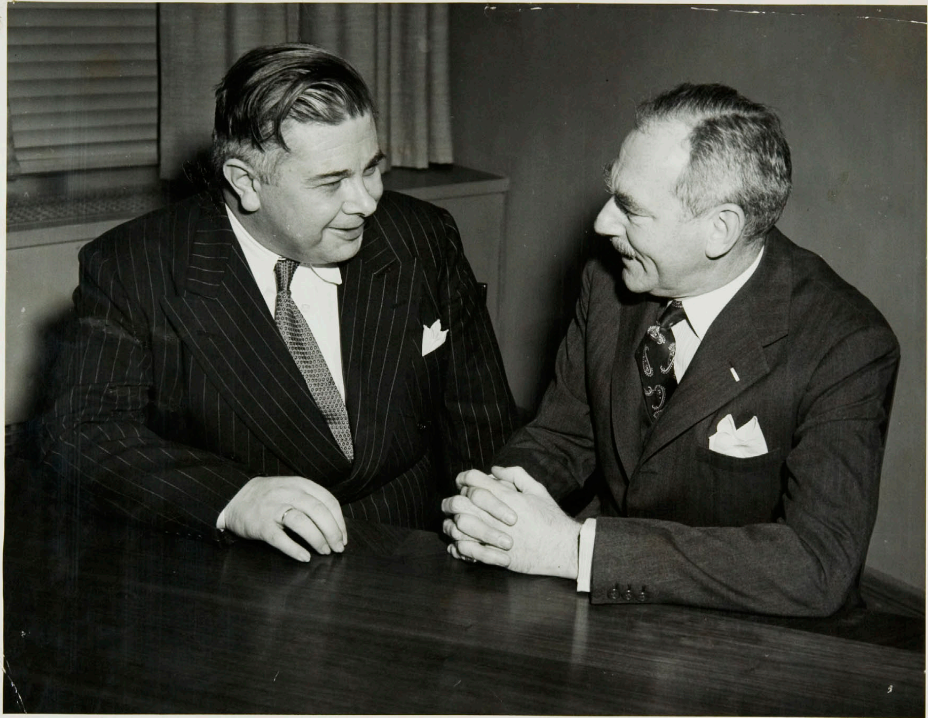
Einkaskjalasafn Bjarna Benediktssonar © Borgarskjalasafn Reykjavíkur