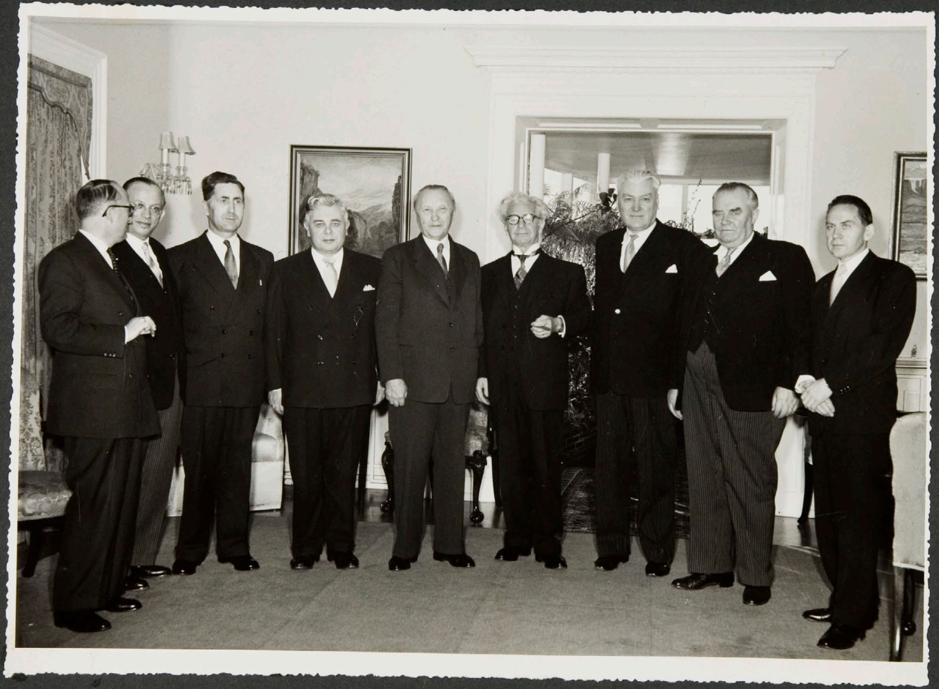
Einkaskjalasafn Bjarna Benediktssonar © Borgarskjalasafn Reykjavíkur