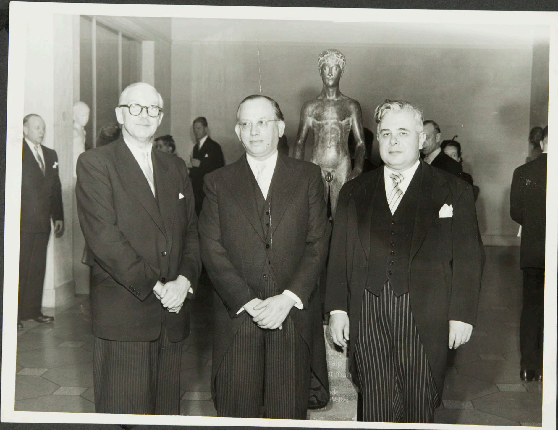
Einkaskjalasafn Bjarna Benediktssonar © Borgarskjalasafn Reykjavíkur