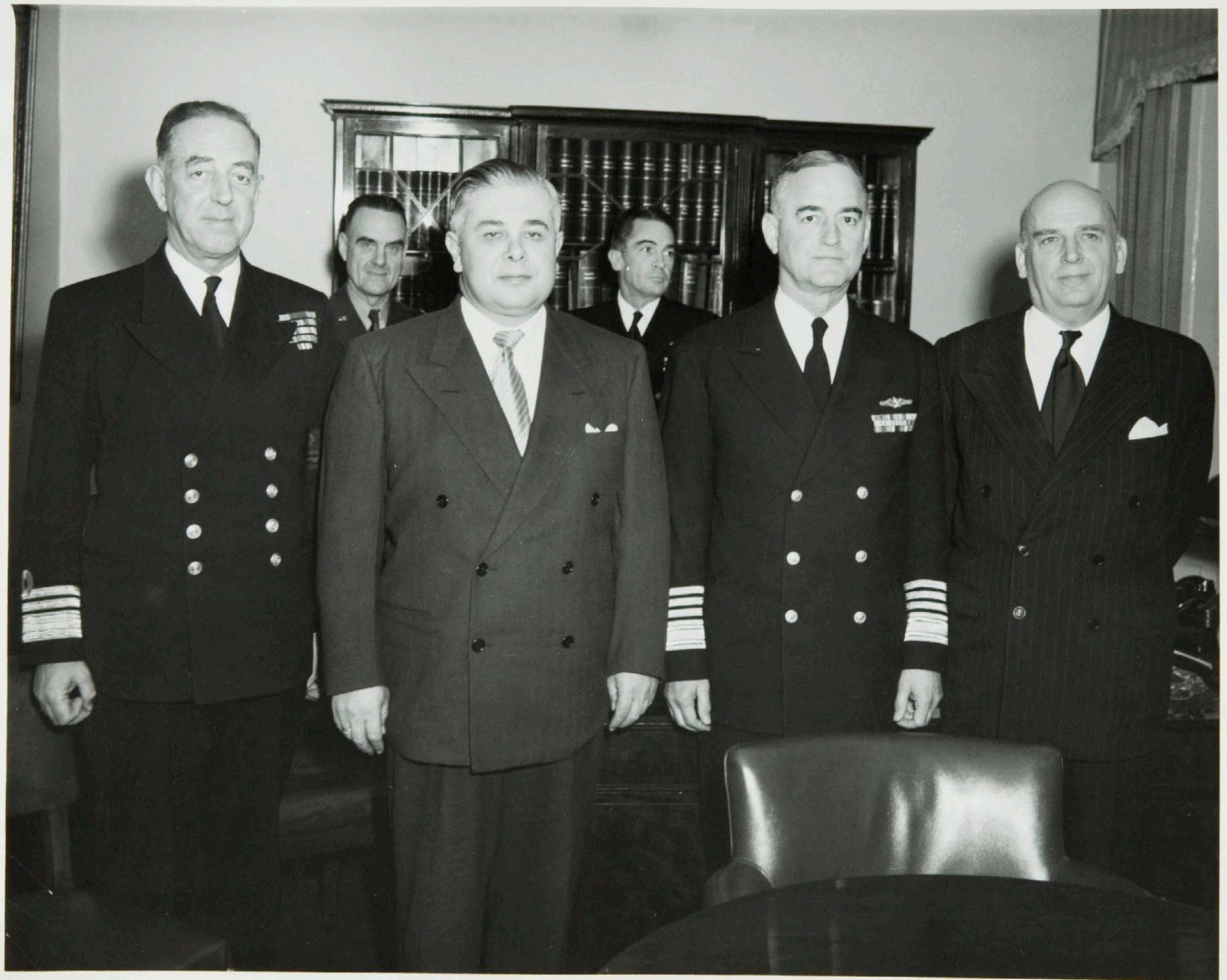
Einkaskjalasafn Bjarna Benediktssonar