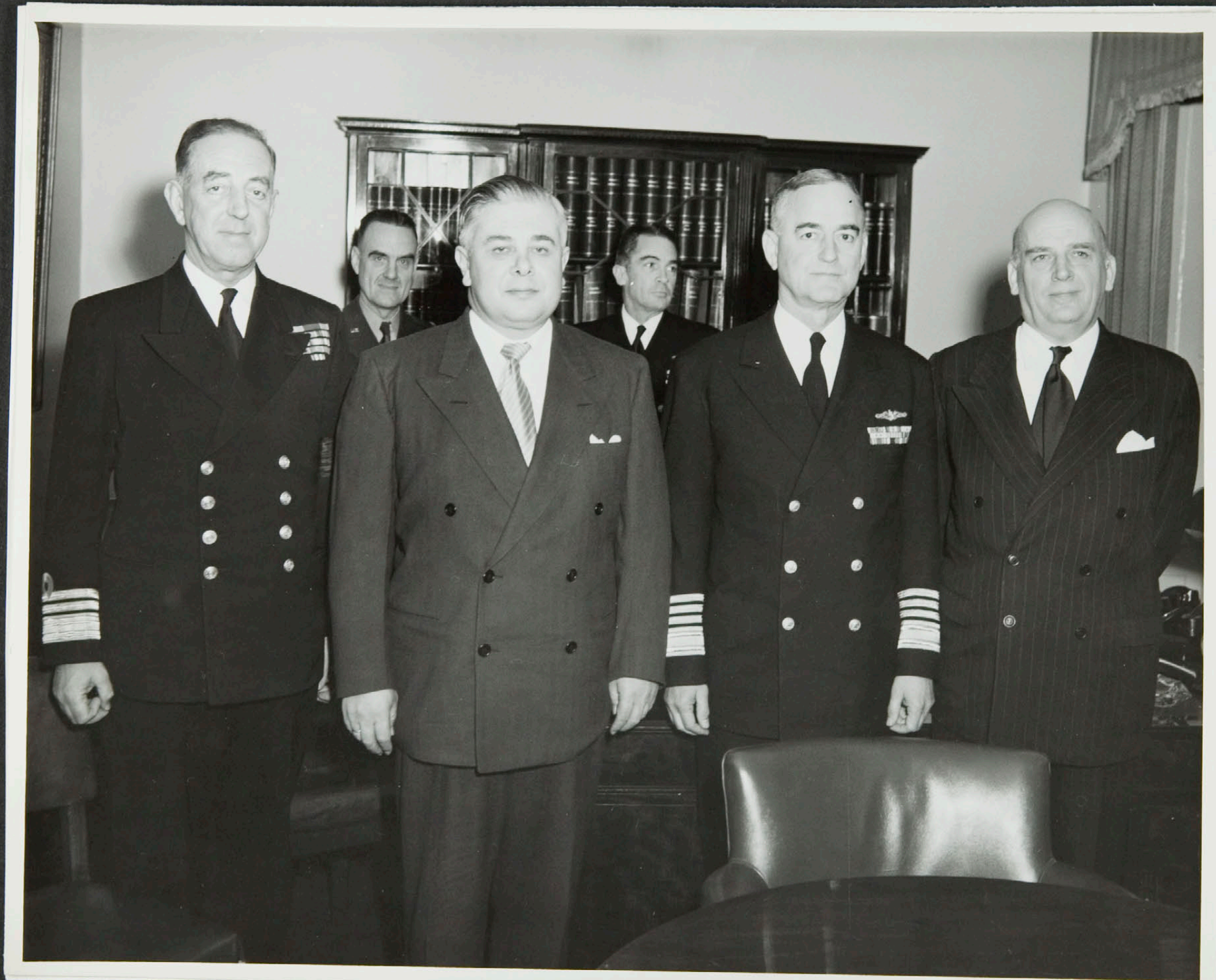
Einkaskjalasafn Bjarna Benediktssonar