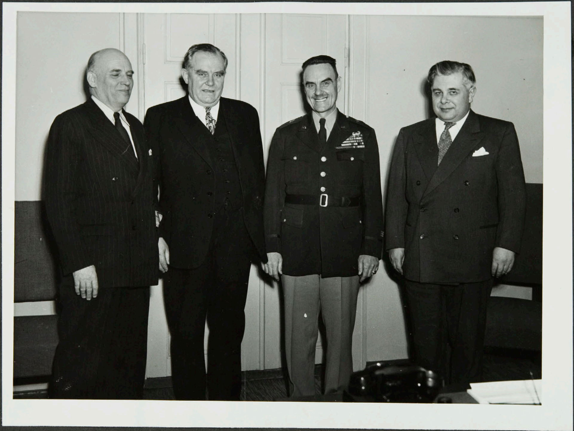
Einkaskjalasafn Bjarna Benediktssonar