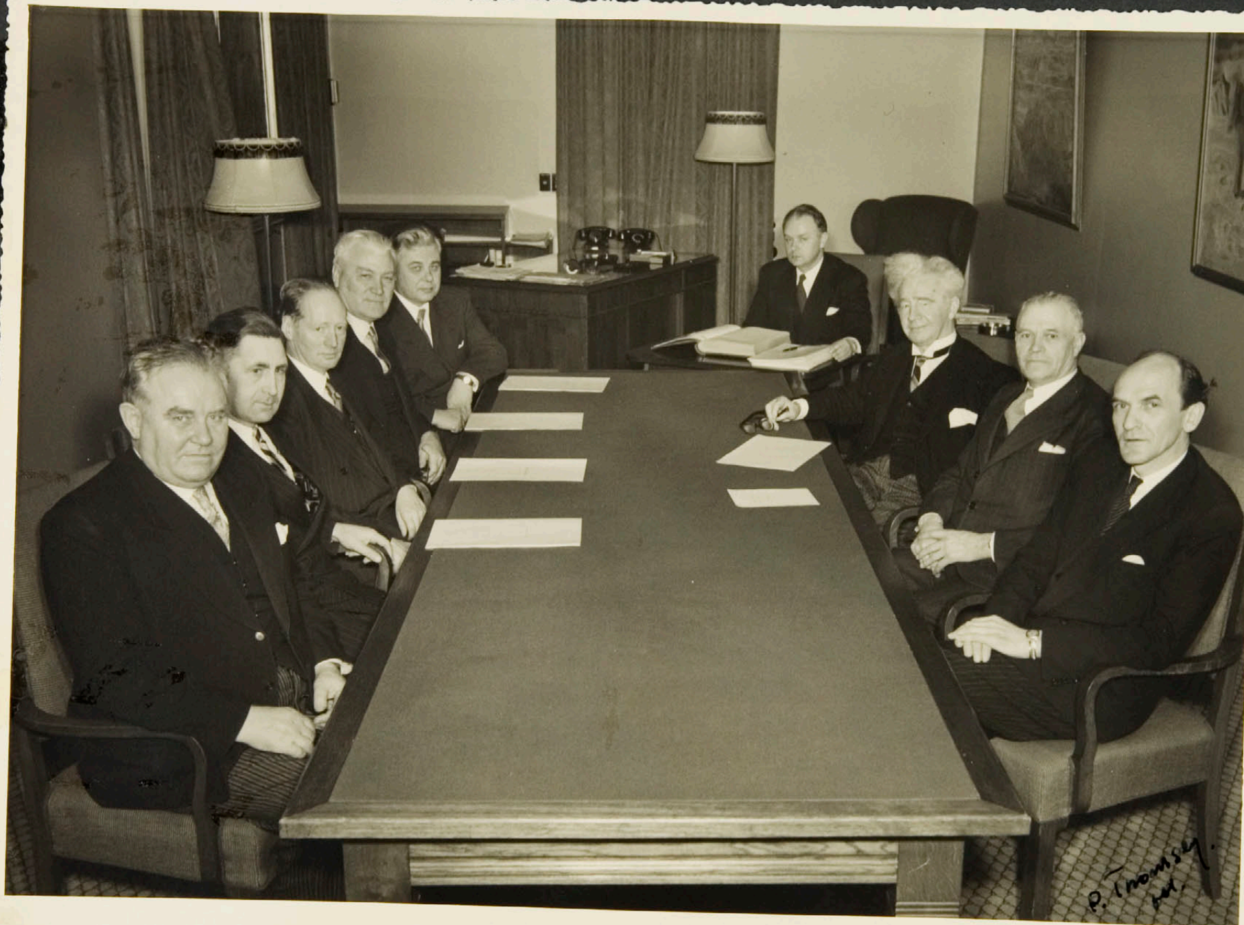
Einkaskjalasafn Bjarna Benediktssonar