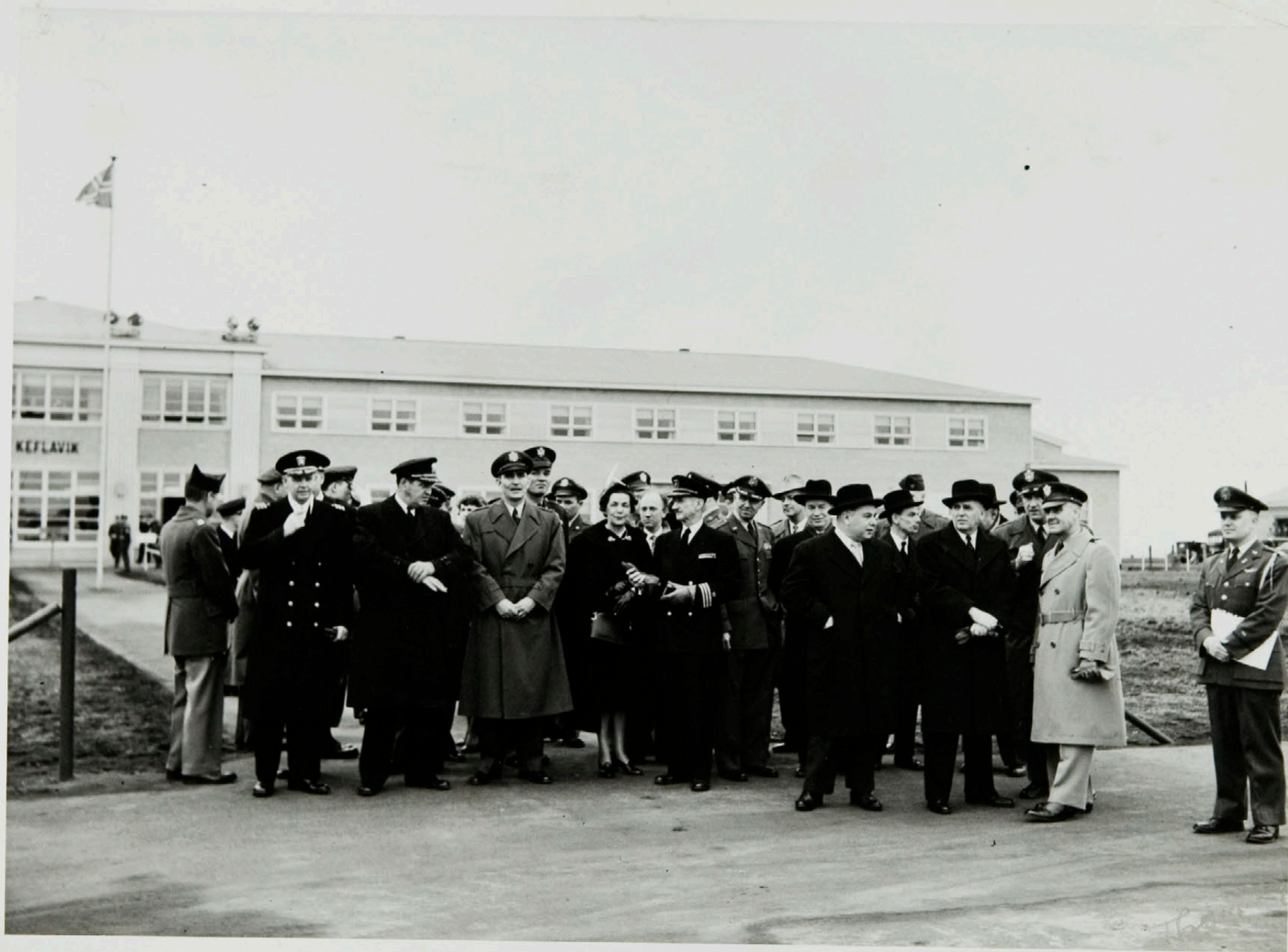
Einkaskjalasafn Bjarna Benediktssonar