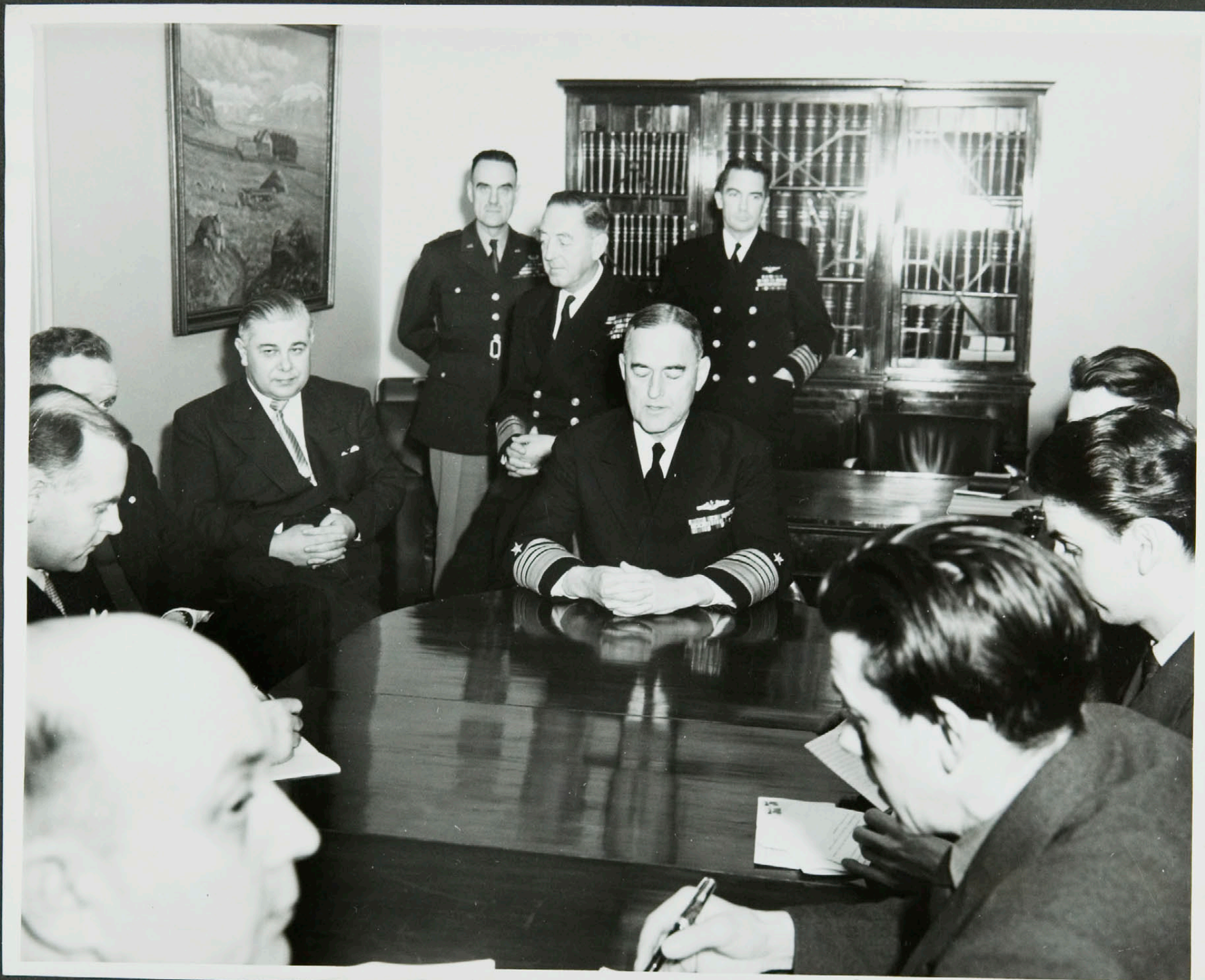
Einkaskjalasafn Bjarna Benediktssonar