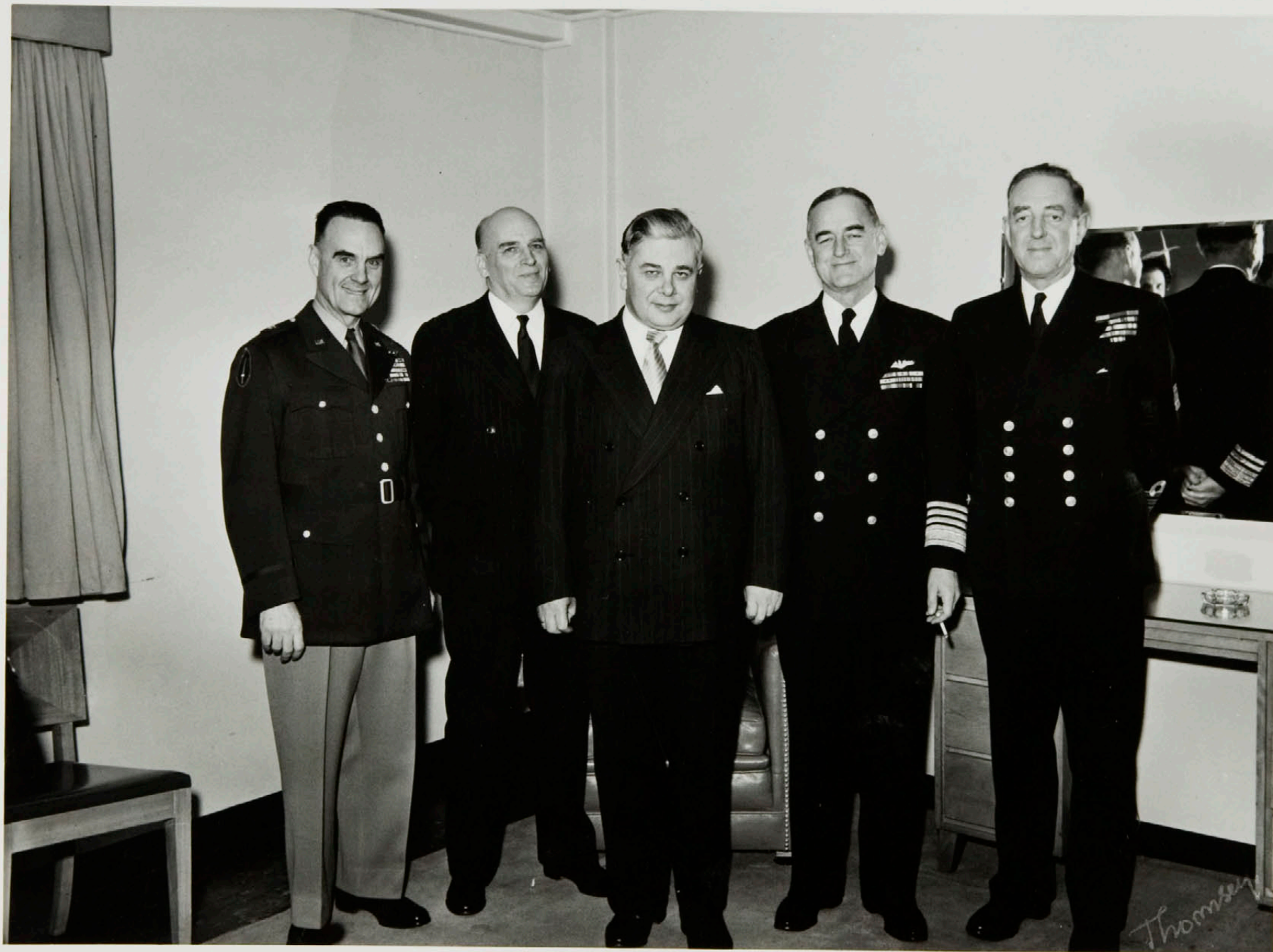
Einkaskjalasafn Bjarna Benediktssonar © Borgarskjalasafn Reykjavíkur