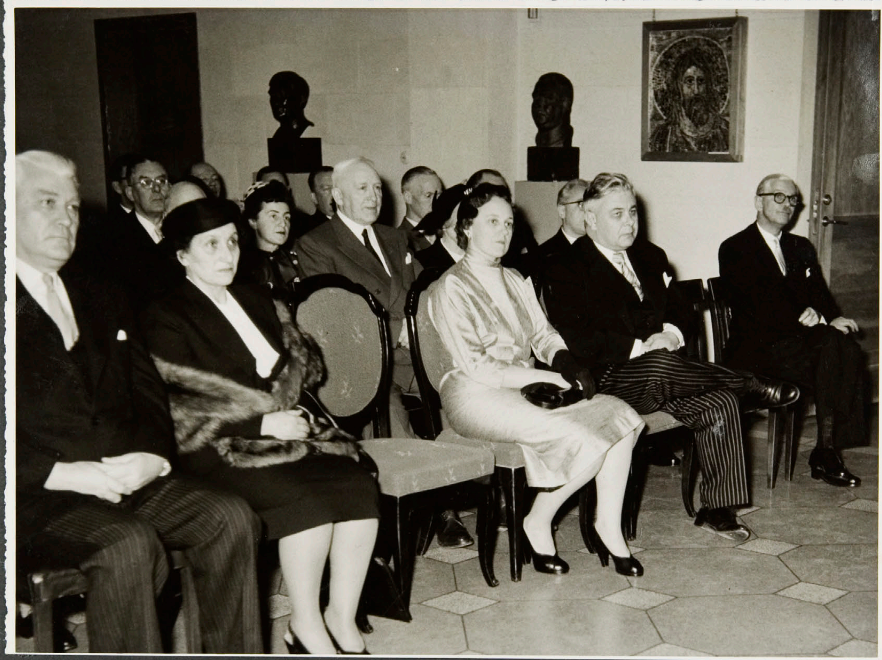
Einkaskjalasafn Bjarna Benediktssonar © Borgarskjalasafn Reykjavíkur