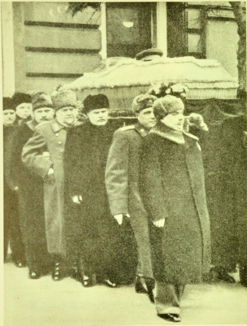
De samme, som regerer i Sovjetunionen i dag, bar som Stalins gamle venner og medarbejdere diktatoren til graven.