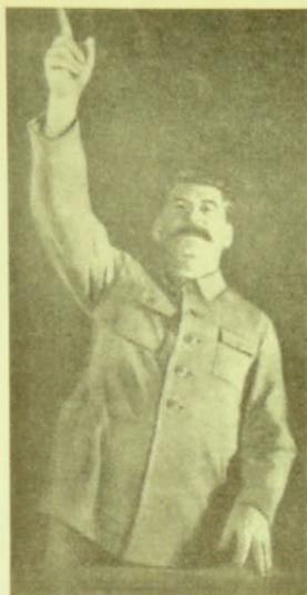
Den store fører,