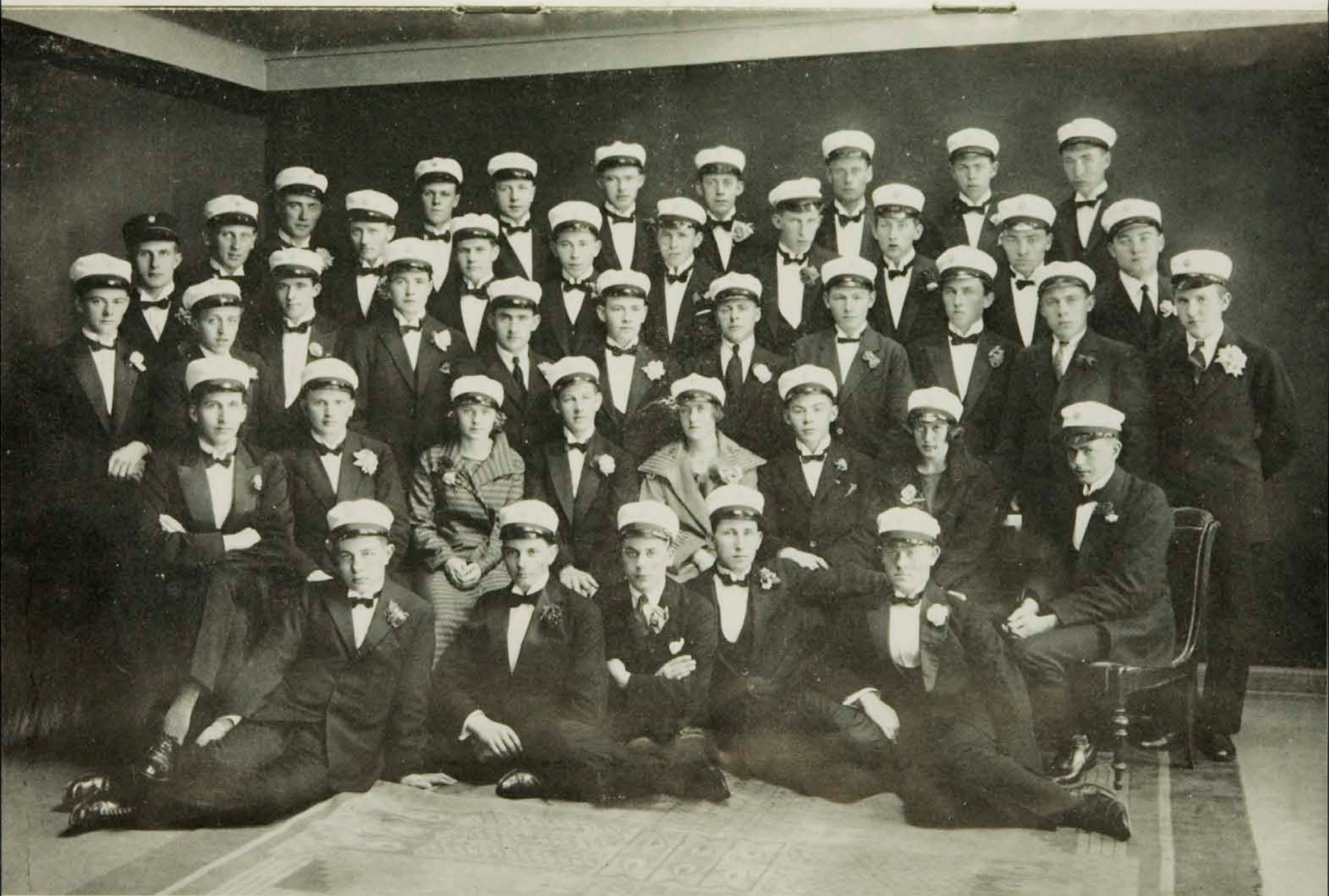
Höfum við nokkuð breytt, börnin góð? — Skoðið myndina vandlega!