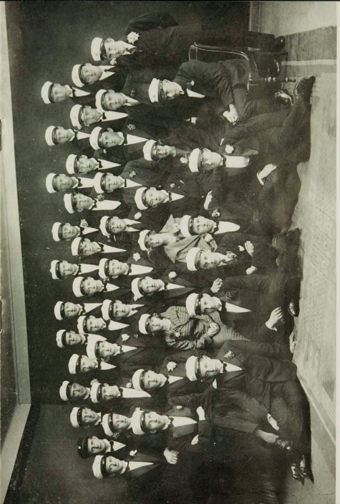
Höfum við nokkuð breytt, börnin góð? — Skoðið myndina vandlega!