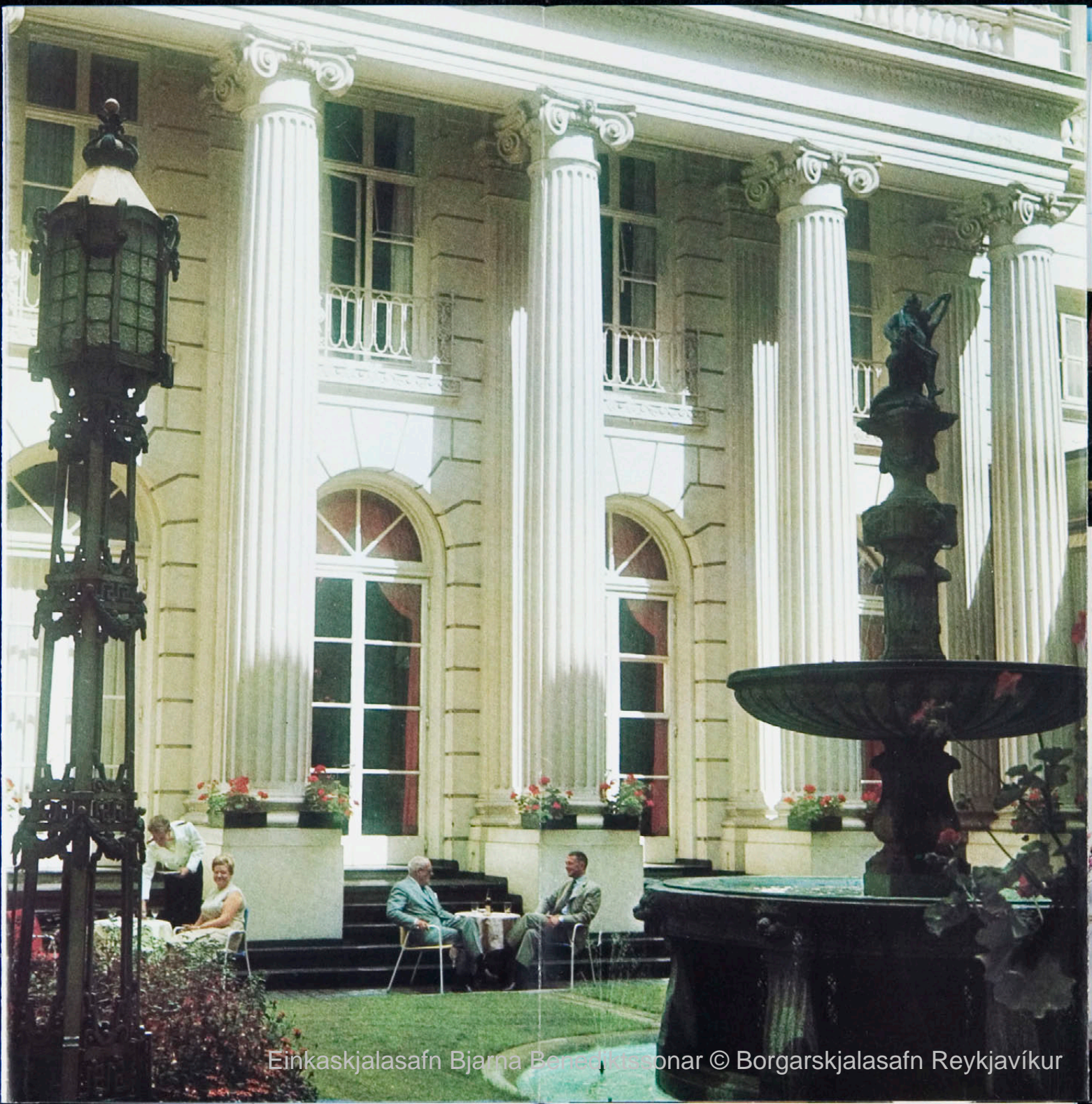
Einkaskjalasafn Bjarna Benediktssonar © Borgarskjalasafn Reykjavíkur