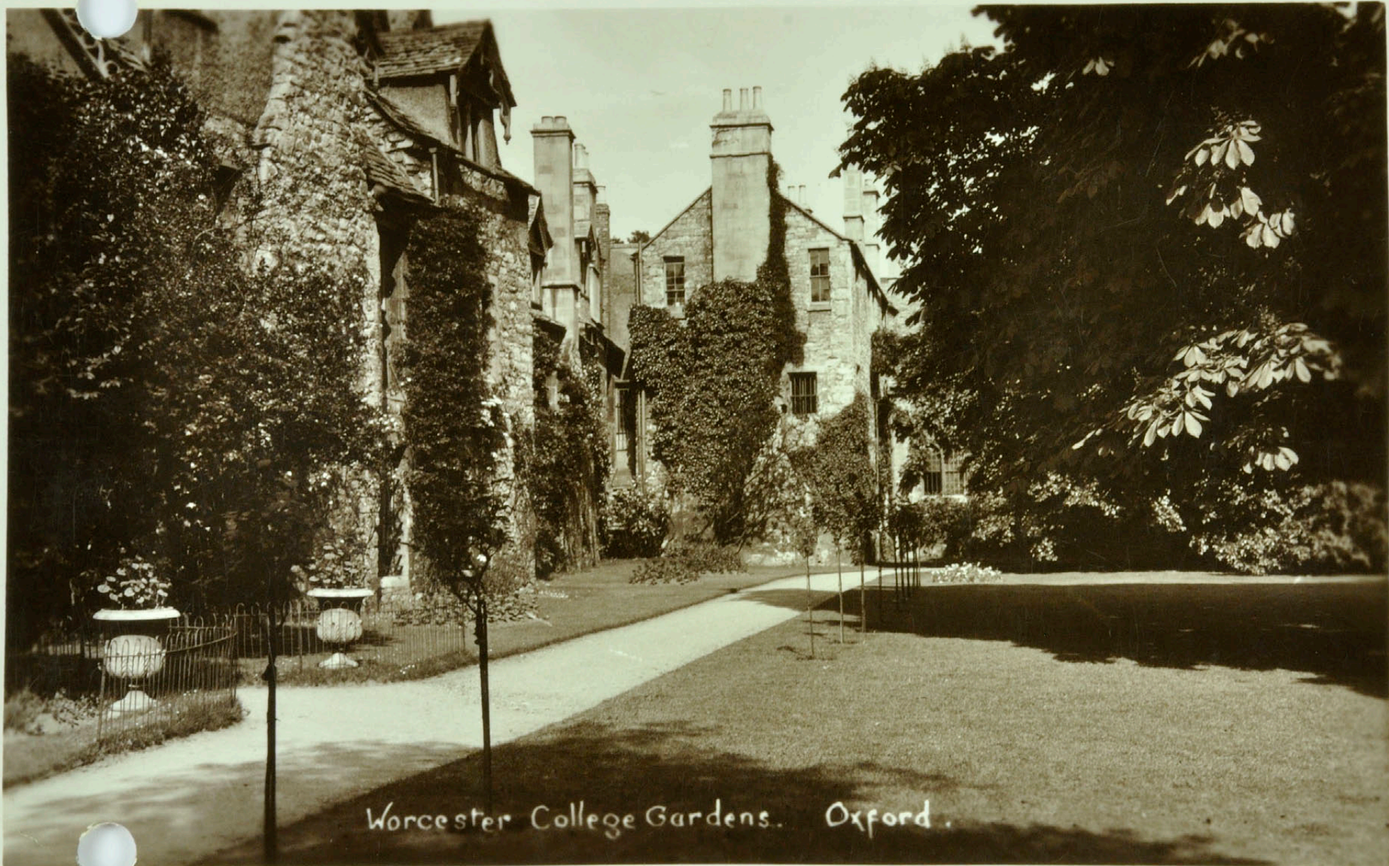
Worcester College Gardens. Oxford.