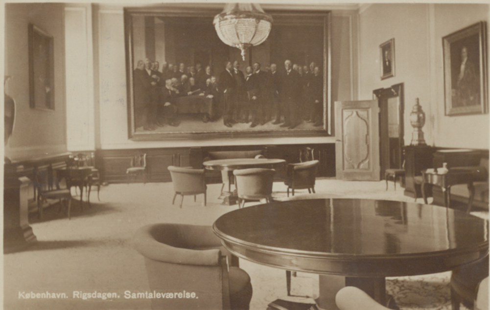
København. Rigsdagen. Samtaleværelse.