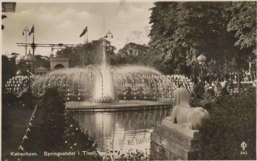
København. Springvandet i Tivoli.