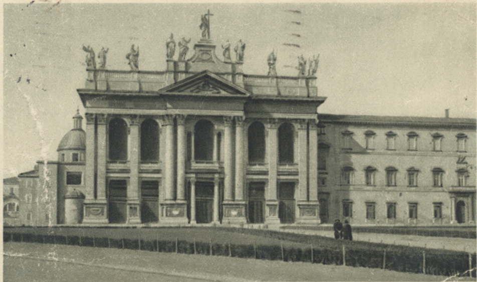
ROMA - Chiesa di S. Giovanni in Laterano.