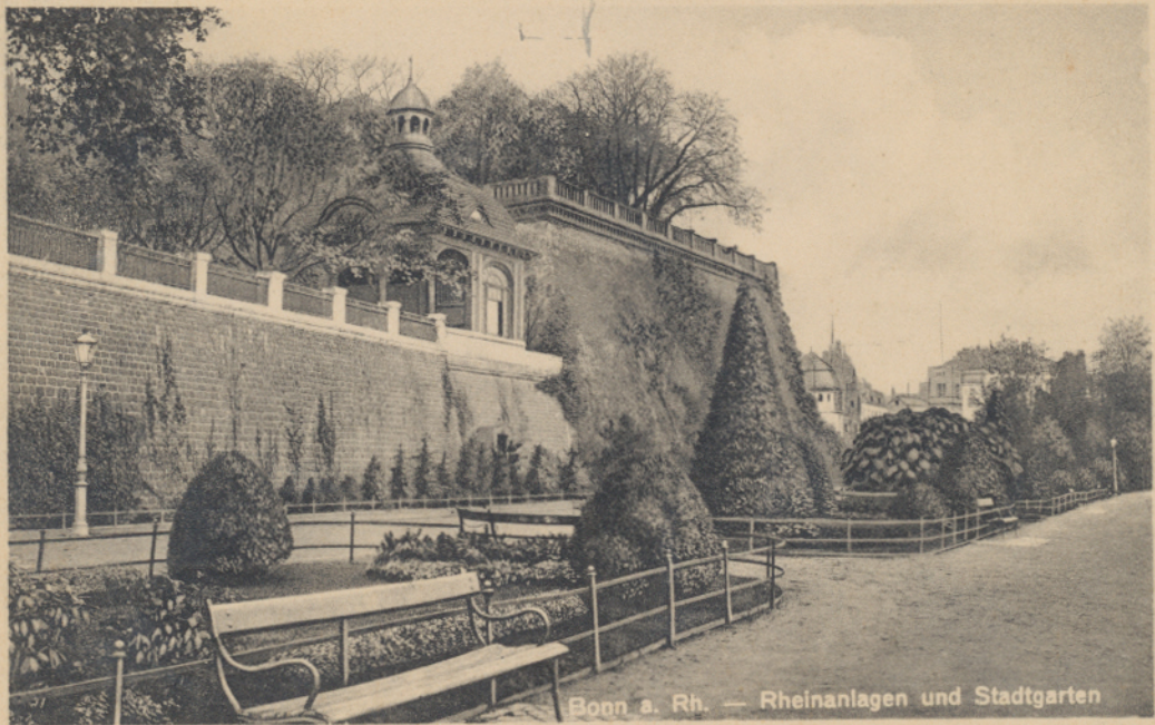
Bonn a. Rh. — Rheinanlagen und Stadtgarten