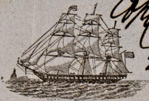
Reid & Son, Printers, Leith.