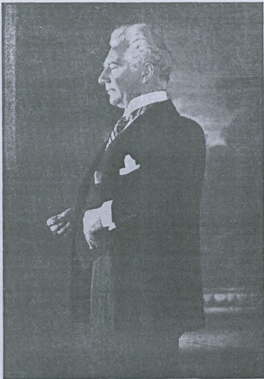
Ólafur Thors forsætisráðherra Nýsköpunarstjórnarinnar.

irliti sést, að Ólafur Thors lifði annasömu lífi og að oft hefur á hann reynt. Til að standa í slíku, er betra að hafa sterk bein og góða heilsu. Heilsa Ólafs var hins vegar aldrei örugg. Hann vildi þó ekki láta hvellsýni eða lasleika á sig fá. Á árinu 1961 var svo komið, að hann hvarf frá störfum til nokkurra mánaða hvíldar, en tók við embætti sínu aftur um áramótin 1961—2. Þegar fram á árið 1963 kom var ljóst, að í sama horfið mundi sækja. Hann sótti þá stjórn- arfundi stundum sárþjáður. Lengst af um sumarið var hann illa haldinn. Um mán- aðamótin september-októ- ber skrapp hann til Dan- merkur á fund forsætisráð- herra Norðurlanda. Þegar hann kom heim þaðan sagði hann mér, að nú treysti hann sér ekki lengur til að halda áfram. Vegna fyrir- sjáanlegra erfiðleika þá á næstu dögum og vikum, kom okkur saman um, að ekki væri hentugur tími til að hann segði þá af sér. Fór og svo að hörð hrið varð þegar á þingið kom. Lagði Ólafur sig þá enn allan