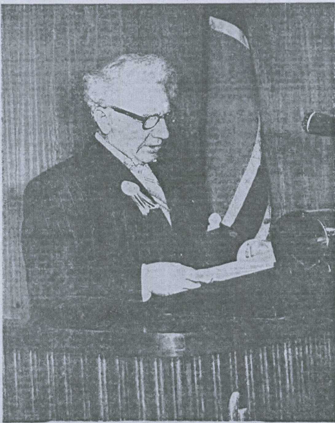
Ólafur Thors flytur ræðu á Landsfundi Sjálfsteðisflokksins.

Allir sem þekktu Ólaf vissu að hann trúði á landið og þjóð. Framhald á næstu síðu.