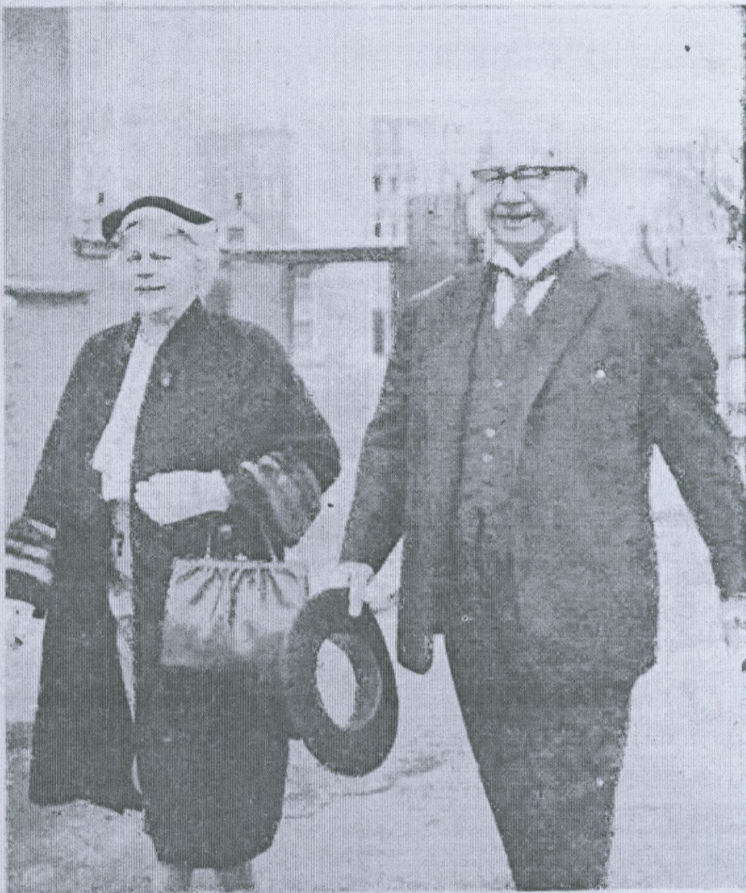
Ólafur Thors forsætisráðherra kemur á kjörstað í kosningunum sumarið 1963, ásamt fru Ingibjörgu Thors konu sinni.