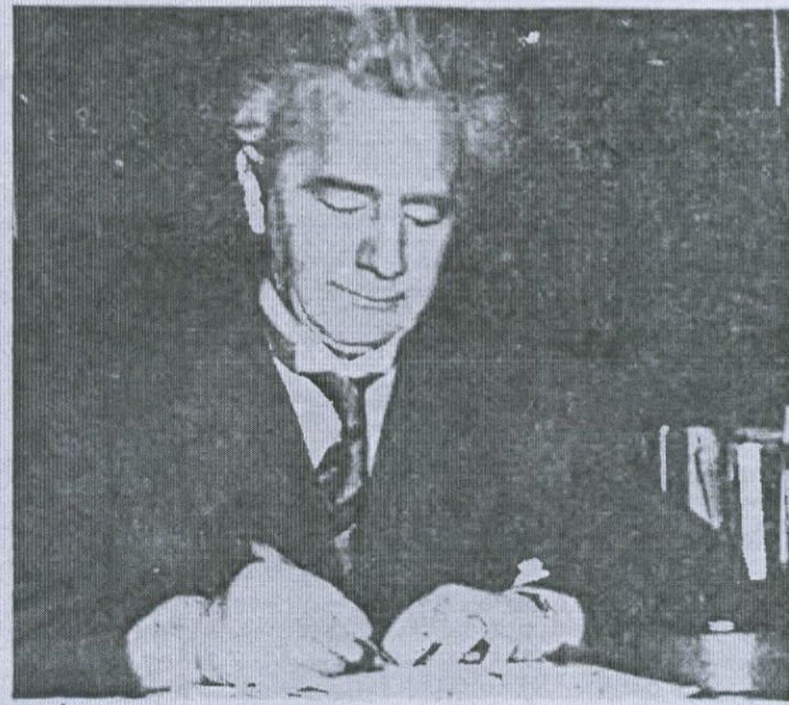
Ólafur Thors atvinnumálaráðherra í Þjóðstjórninni 1939—1942