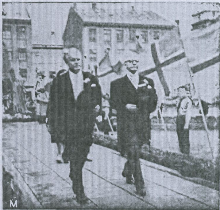
M Ólafur Thors forsætisráðherra og Ásgeir Ásgeirsson forseti Íslands koma frá því að leggja blómsveig að minnisvarða Jóns Sigurðssonar á Austurvelli á Þjóðhátiðardaginn 1954.