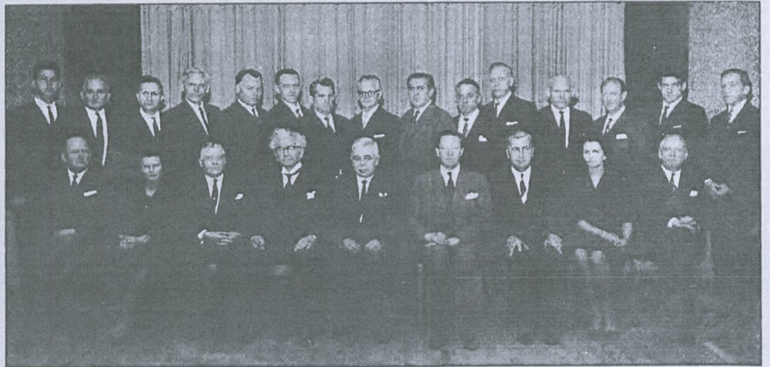
Þingflokkur sjálfstæðismanna haustið 1959.

Sjálfstæðisflokksins höfðu jafnaðarmannaflokkar á hinum Norðurlöndunum aukið mjög fylgi sitt og voru sterkustu flokkar hver í sínu landi. Ólafi var það ljóst að ekkert var Sjálfstæðisflokknum meira virði en að hann væri samtök breiðrar fylkingar sem hefði einstaklingshyggjuna að leiðarljósi, en tæki þó fullt tillit til allra stétta og legði grundvöllinn að því að skapa betra og réttlátara líf fyrir allar stéttir þjóðfélagsins. Þess vegna varð Sjálfstæðisflokkurinn þá, og síðar, það stjórnmálaafli sem fólk úr öllum stéttum þjóðfélagsins gat stutt og