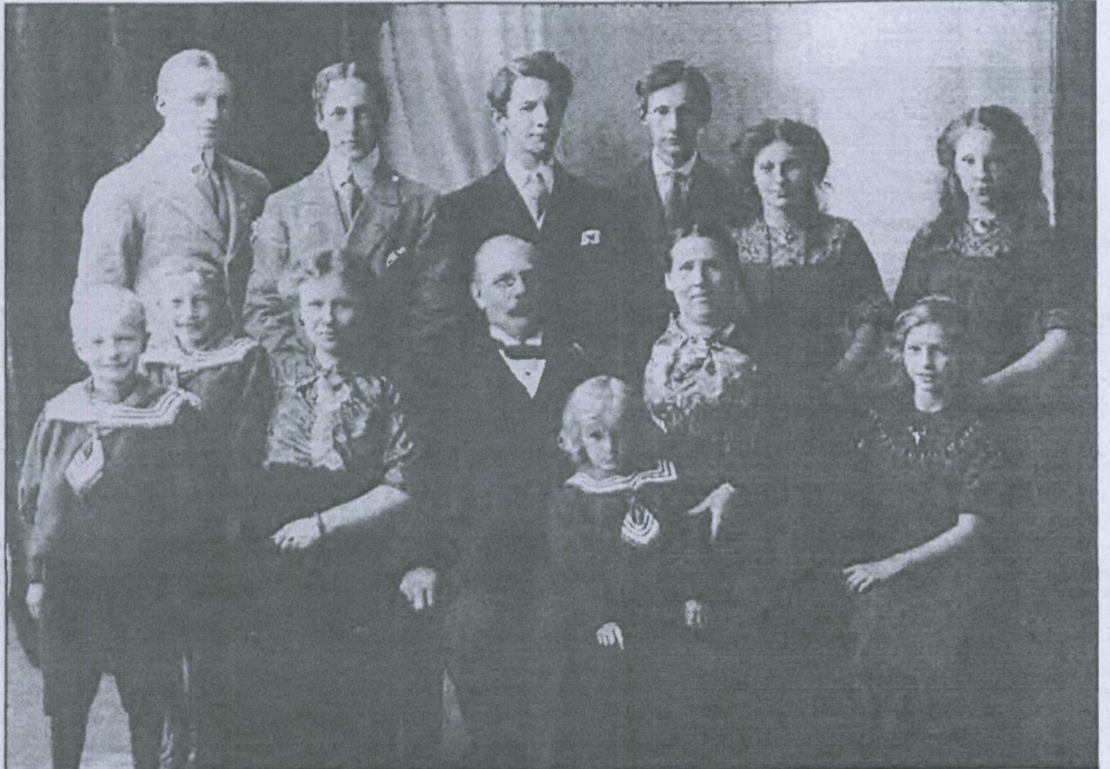
Margrét og Thor Jensen ásamt börnum sínum. Aftari röð f.v.: Richard, Kjartan, Ólafur, Haukur, Kristín, Kristjana. Fremri röð: Lorentz, Thor, Camilla. Fyrir framan foreldrana: Hilmar, þá Margrét.

Því er það að ef ég ætti að lýsa Ólafi Thors í einni setningu þá væri hún: Hann var sannur drengskaparmaður. Það sést m.a. af því að andstæðingar hans gátu aldrei borið á hann nokkurn hlut, sem ekki sómdí heidarlegum og dreng-