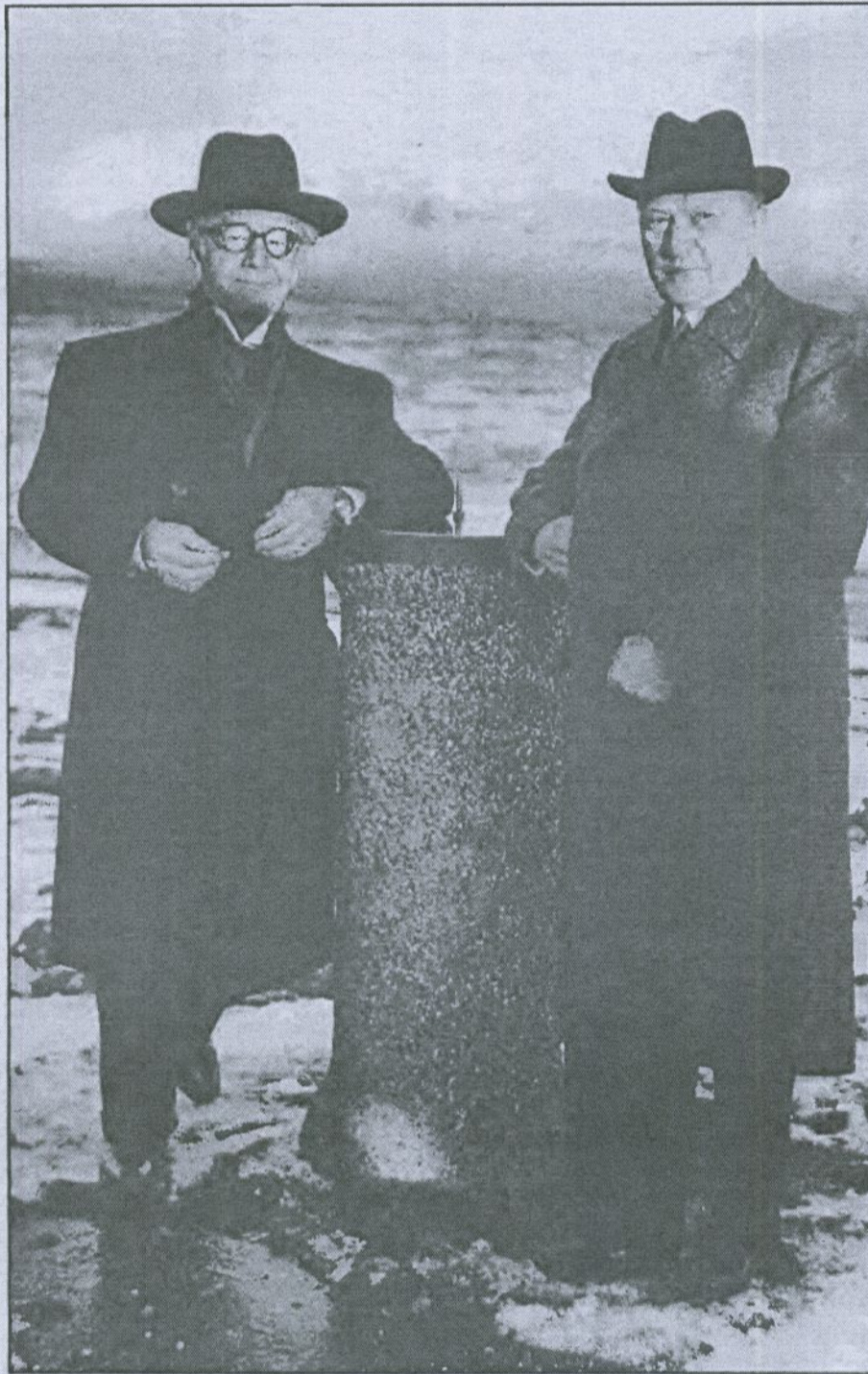
Ólafur Thors forsætisráðherra ásamt Konrad Adenauer á þlugvöllum í október 1954.