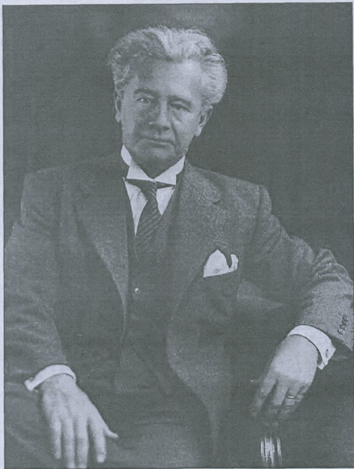
Ólafur Thors, formaður Sjálfstæðisflokksins 1934–1961 og forsætisráðherra 16. maí 1942 – 16. desember 1942, 1944–1947, 1949–1950, 1953–1956 og 1959–1963.

ÓLAFUR THORS var einhver/svipmesti stjórnmálaforingi Íslendinga á þessari öld. Réttilega sagði Bjarni Benediktsson að Ólafi látnum: „Hann var sjálfkjörinn foringi og menn nutu leiðsögu hans með ljúfu geði.“