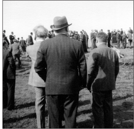
Horft til framtíðar. Þessi mynd var tekin í lok landsfundar 1943, þar sem ákveðið var að stofna lýðveldið. Gengið var að Lögbergi. F.v.: Ólafur Thors, Pétur Magnússon, Bjarni Benediktsson.

Pétur var, ásamt Bjarna Benediktssyni, helsti ráðunautur miðstjórnar Sjálfstæðisflokksins og formanns hans um lögfræðilegan og pólitískan undirbúning þess að Íslendingar tækju sjálfir við allri forystu í eigin málum og stofnuðu