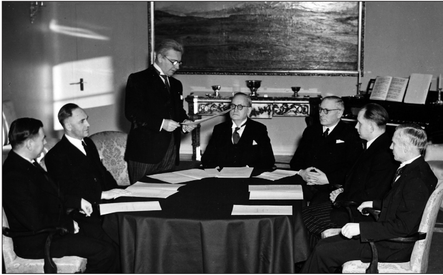
Nýsköpunarstjórnin (1944–1947). F.v.: Emil Jónsson, Finnur Jónsson, Ólafur Thors, Sveinn Björnsson (forseti Íslands), Pétur Magnússon, Áki Jakobsson og Brynjólfur Bjarnason.

Er nú komma eina von orðin Pétur Magnússon.