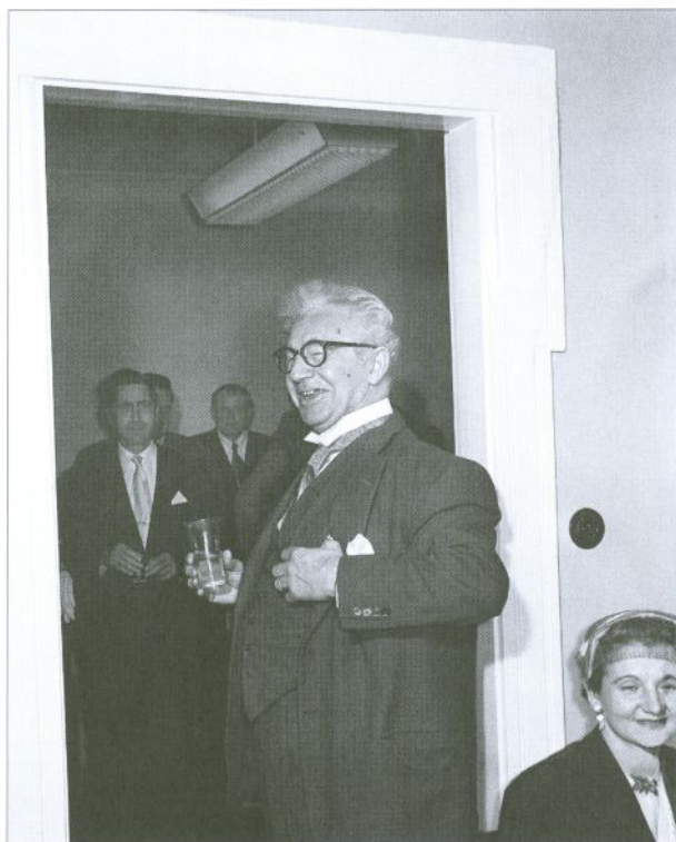
Ólafur Thors flytur tækifærissæðu. Sagt er að Ólafur hafi áminnt bílstjóra sinn eftir að sá hafði verið tekinn fyrir ökvunaraktur skömmu eftir að Ólafur varð fyrst forsætisráðherra og sagt: „Nú verður annar þvör okkar að hætta að drekka.“

Þann tíma virtist fullkominn einhugur í flokknum um forystu hans þótt þingmenn flokksins deildu hart um sumar ákvarðanir hans, svo sem þátttöku í Þjóðstjórninni 1939 og myndun nýsköpunarstjórnarinnar 1944, og stuðningsmenn flokksins hefðu tilmæli formanns síns að engu í forsetakosningunum 1952. Einn af eftirmönnum Ólafs, Davíð Oddsson forsætisráðherra, komst síðar svo að orði að Ólafur hefði í vissum skilningi verið maður allra tíma: Meðan hann var ungur hafi sjálfstæðismenn viljað að ungur maður leiddi flokkinn, þegar hann var miðaldra hafi hið sama gilt og þegar hann var sjötugur hafi Ólafur enn verið sá leiðtogi sem flokksmenn töldu sjálfkjörinn formann sinn. 51