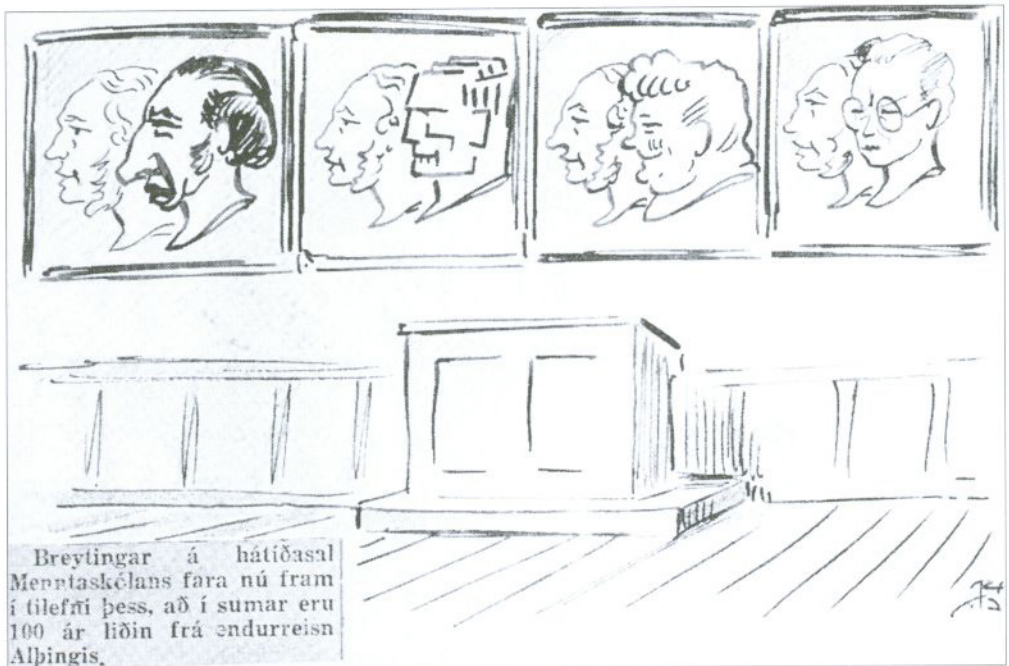
Speglinum þótti forystumenn íslenskra stjórn mála árið 1945 – eitt hundrad árum eftir endurreisn Alþingis – lítt standast samanburð við Jón Sigurðsson. Teikninguna gerði Tryggvi Magnússon.